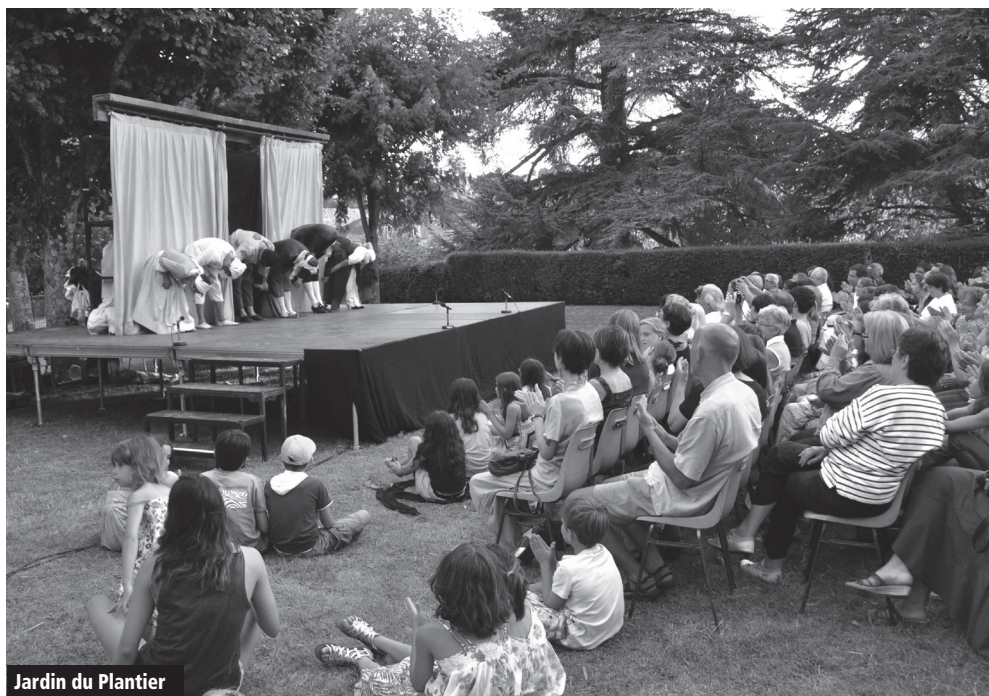
Jardin du Plantier